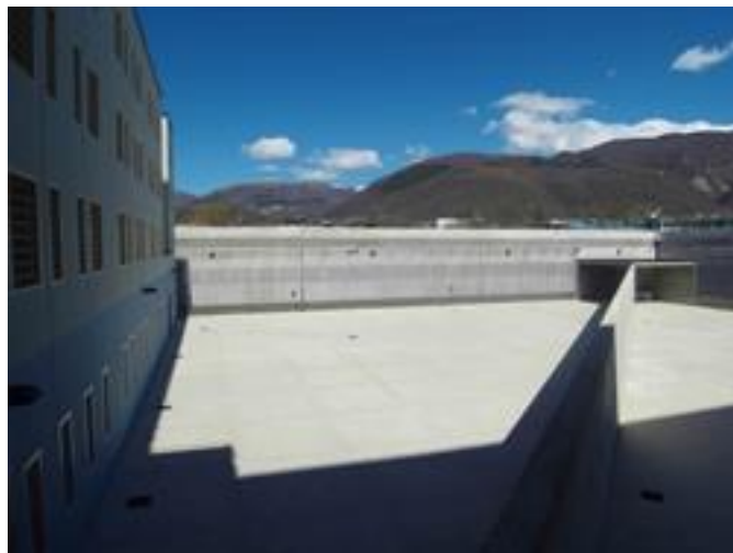
Cortile interno nella zona detenzione