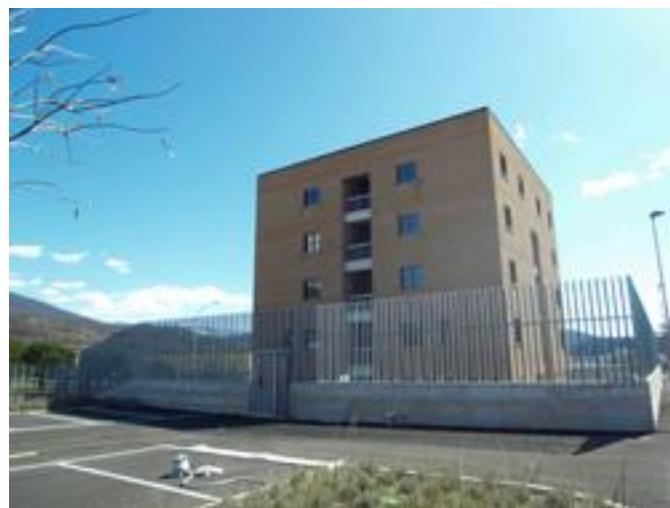
Alloggi per il personale