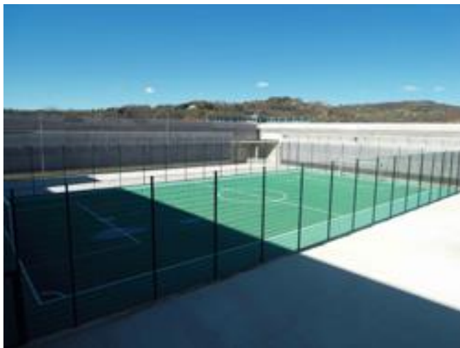
Campo di calcio