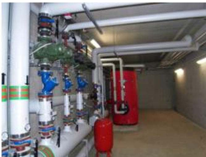
Particolare dell'impianto idrico