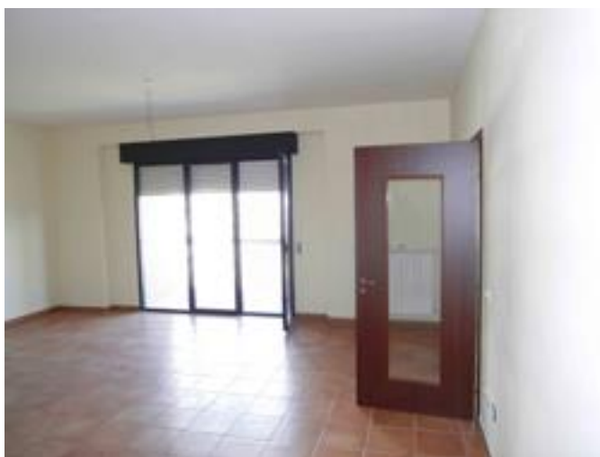
Particolare interno alloggio per il personale