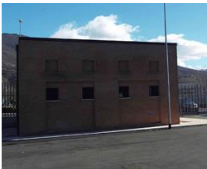
Posto di controllo in prossimità dell'accesso alla casa circondariale