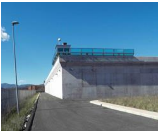
Particolare del muro di cinta visto dall'esterno della zona di reclusione