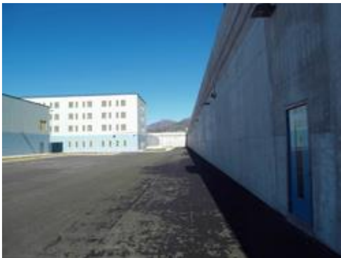
Vista all'interno del muro di cinta