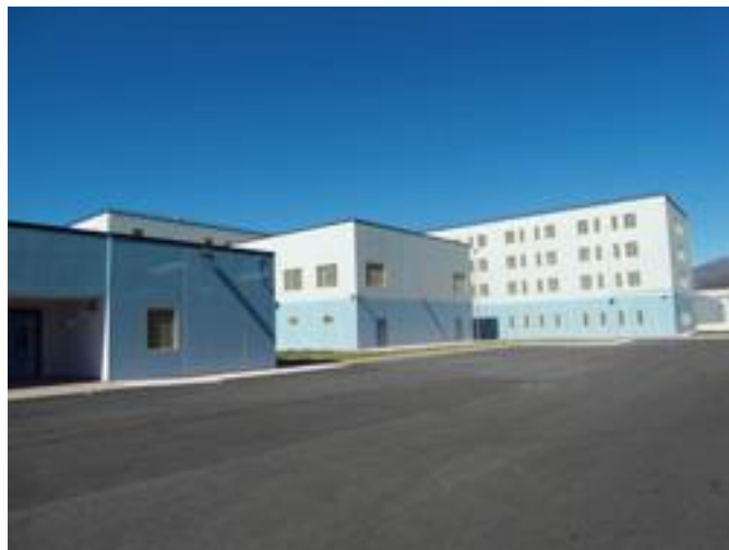
Vista all'interno del muro di cinta