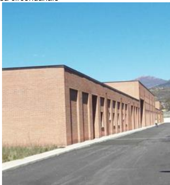
Uffici di direzione (al centro) autorimessa e centrali tecnologiche