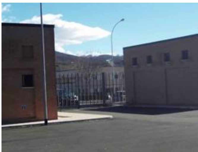
Accesso alla casa circondariale visto dall'interno