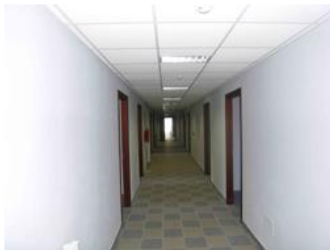
Interno alloggio caserma agenti