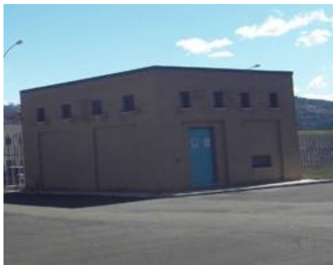
Cabina elettrica in prossimità dell'accesso alla casa circondariale