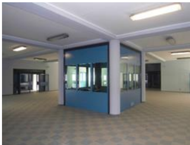
Nodo distributore funzionale al controllo dei bracci di reclusione