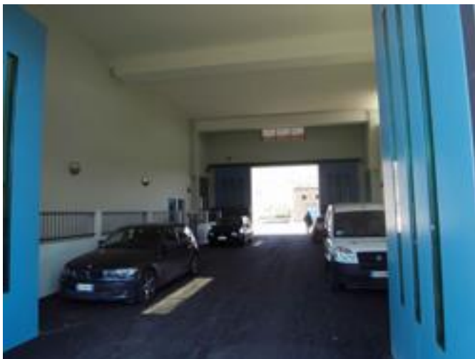
Interno della porta carraia