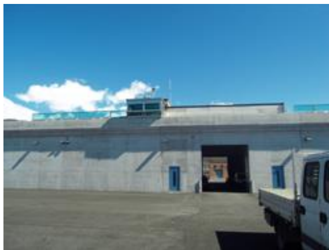
Muro di cinta visto dall'interno della zona di reclusione; al centro la porta carraia